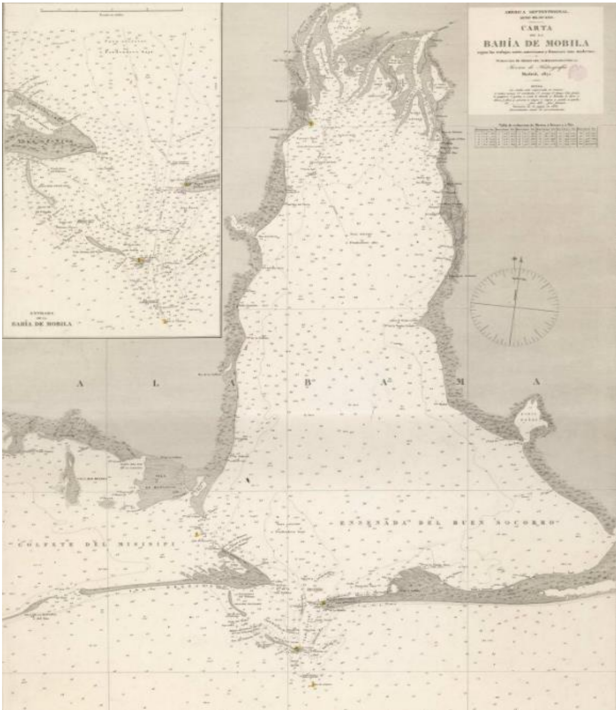
Extraído de: Archivo Biblioteca Nacional de España, MA00013258, 1782. Carta Náutica de la Bahía de Mobila según los trabajos norteamericanos y franceses más modernos.